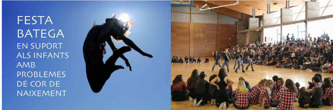
Participaron más de 600 personas entre bailarines, representantes de las Administraciones, colaboradores y voluntarios.