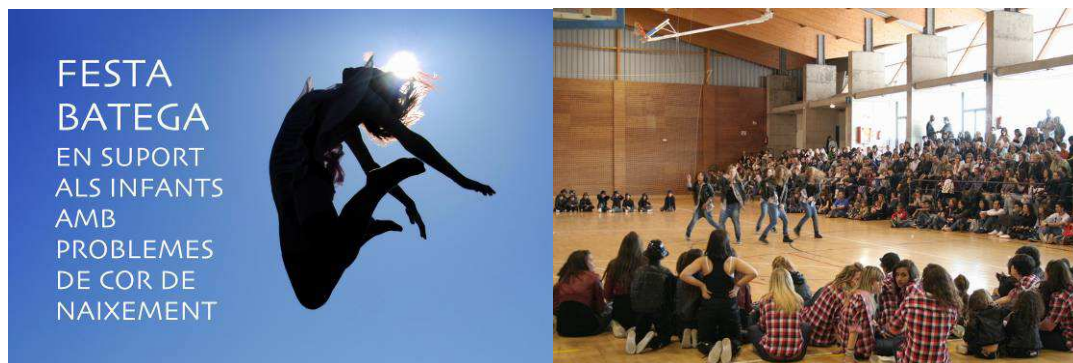
Van participar més de 600 persones entre ballarins, representants de les Administracions, col·laboradors i voluntaris.