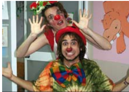
Uns voluntaris d'hospital de l'AACIC a Vall d'Hebron

En total, 177 voluntaris han treballat en diferents serveis i projectes de l'entitat.