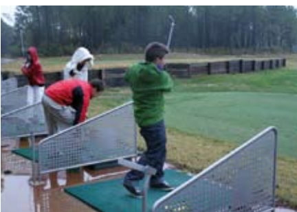
El grup d'adolescents de l'AACIC jugant a golf