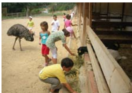
Colònies d'estiu 2008 a Collserola