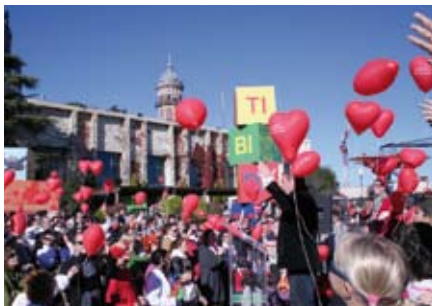
"El seu cor et demana festa" al Tibidabo