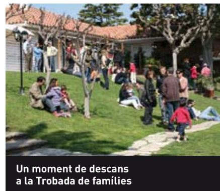
Un moment de descans a la Trobada de famílies

En una sessió de l'espai de pares de Tarragona de l'AACIC, la mare d'un nen amb cardiopatia de Tivissa comentava: "Quan vas a l'hospital a Barcelona per primer cop, amb el teu fill acabat de néixer, t'atabales, se't fa una muntanya, estàs desorientat i sobretot et sents molt sol. Poder tenir l'acompanyament de les psicòlogues de l'AACIC durant tot el procés inicial va ser un descans, un gran consol, no es podria pagar amb diners...per fi un lloc on ens entenien i ens escoltaven. Sabien de què els hi parlàvem."