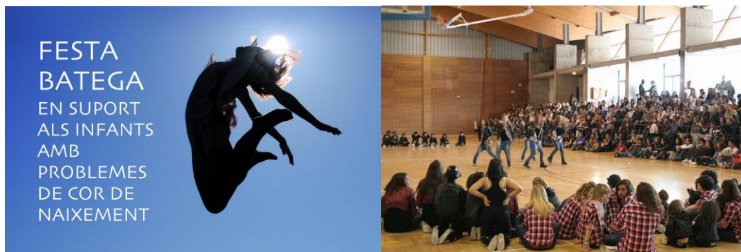
Van participar més de 600 persones entre ballarins, representants de les Administracions, col·laboradors i voluntaris.